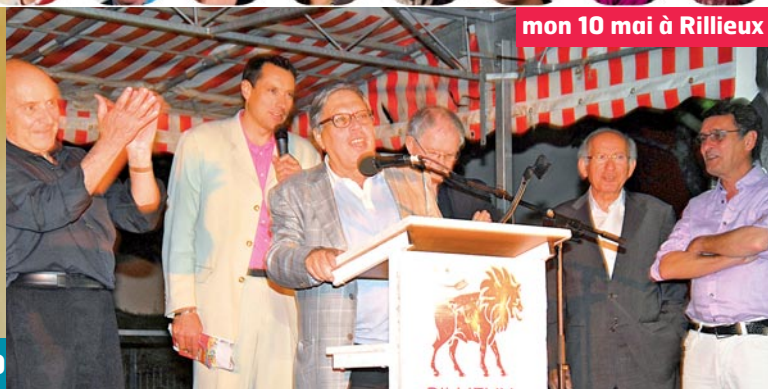
mon 10 mai à Rillieux